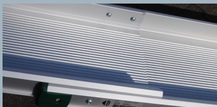
Auf 1,2 Meter zusammenschiebbar