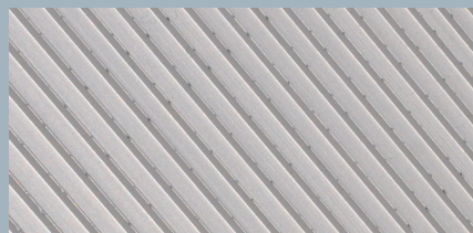
Ausschnittvergrößerung des Aluminium-Spezialprofils