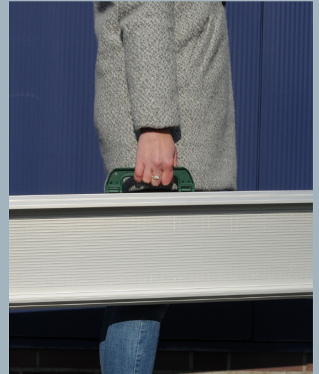
Haltegriffe erleichtern das Tragen der Auffahrschienen